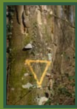
Arbre "bio" ne pouvant être abattu (utile à la biodiversité)

Les coupes réalisées vont fournir essentiellement du bois Energie, et une petite proportion de bois d'œuvre, qui sera confiée à des scieries locales pour transformation ou mise en vente par adjudication.