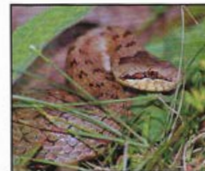
Coronelle lisse dans un pré.