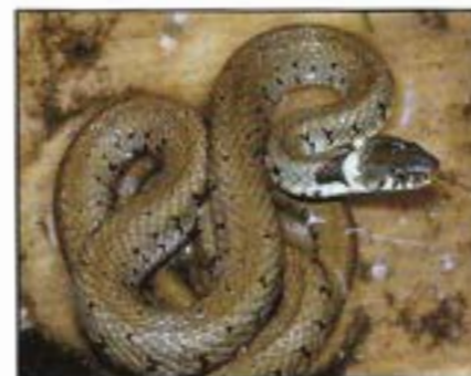
Couleuvre à collier dans une mare.

On peut par exemple, soulever l'animal à l'aide d'une fourche ou d'un bâton et le déposer dans une poubelle, ou tout simplement plaquer l'animal au sol avec un balais, en attendant des secours (sapeurs-pompiers, équipe animalière, Brigade verte, l'Herpétologue).