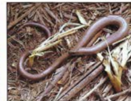
Orvet sur un tas de compost.

Société Herpétologique d'Alsace Président fondateur Maurice Babilon 52, Rue de l'été 68460 LUTTERBACH Haut-Rhin Tel : 03.89.50.43.69 Port : 06.81.31.07.81