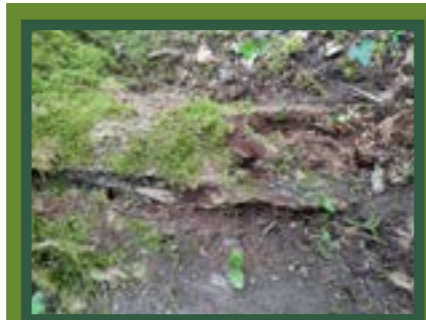
Un frêne atteint par la chalarose

Pour faciliter le débardage du bois, des cloisonnements d'exploitation de 4m de largeur ont été créés afin de limiter le tassement du sol lors du passage des engins.